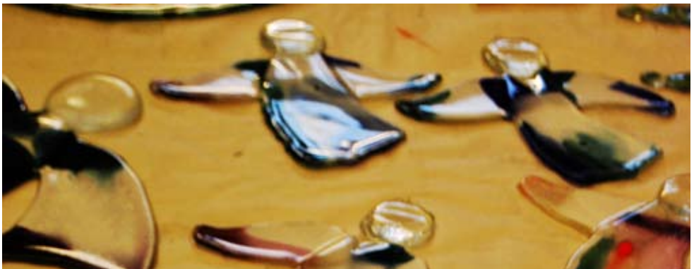
Bild: Ängel från kooperativet KOS glasverkstad.

En regional utvecklingsgruppsgrupp bildades i slutet av 2009 för att driva frågan på länsnivå.